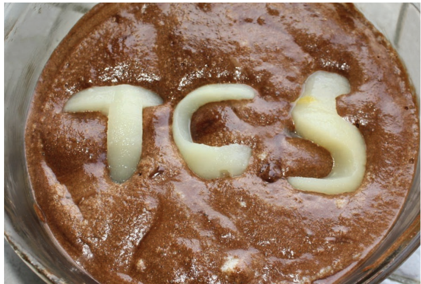
Mousse de chocolate casero.

De manera similar, los algoritmos diseñados para producir una salida particular (e.g. ordenar un arreglo) implícitamente describen un objeto a través de su proceso (e.g. codificar una permutación), y es poco el trabajo adicional requerido para almacenar ese objeto (e.g. anotando el resultado de cada comparación realizada por el algoritmo de ordenamiento). En algunos casos particulares (e.g. merge sort ), esta codificación ha resultado ser útil (e.g. estructuras de datos comprimidas para permutaciones, más pequeñas y más rápidas que las previamente conocidas). BITS